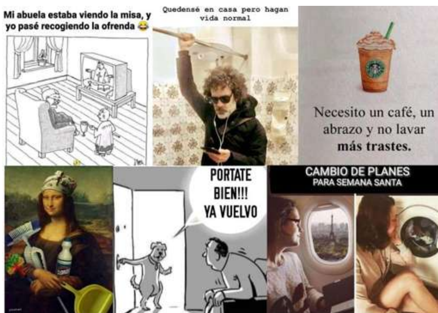
FIGURA 6 Memes con el referente del aislamiento social

En los memes de la figura 5 el sentido de los mensajes ha cambiado. Ahora se abordan otros temas y los entrelazan poniendo de manifiesto la posible escasez de papel higiénico o de alcohol durante el encierro en la pandemia. En ellos se siguen mostrando acontecimientos que suceden dentro del mismo aislamiento social que se inició ante el mensaje de “quédate en casa”, como ya lo mencionamos anteriormente, y que ahora utilizan el sentido del trueque. Aquí ya no se refieren únicamente a la escasez de un producto, también a la necesidad de hablar o platicar con alguien. Cabe mencionar que en ellos sigue prevaleciendo el carácter lúdico que caracteriza a este tipo de mensajes.