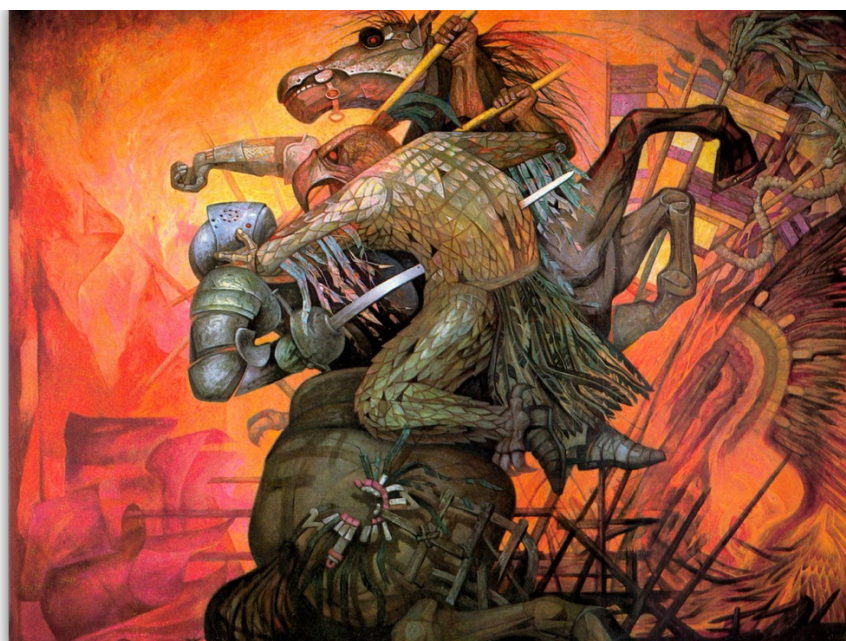
Figura 1. La fusión de dos culturas. Jorge González Camarena. 1963. Acrílico sobre tela. Sala 2 del Castillo de Chapultepec, Ciudad de México.

En segunda instancia se produce un análisis iconográfico de la obra. Es decir, qué se percibe en el espacio pictórico, la descripción de lo que se ve a simple vista y la edificación de los elementos presentes como el traje, la armadura y el armamento de los personajes situados en el mural.