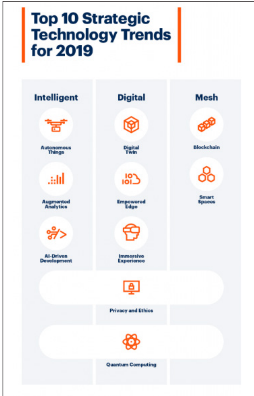
Figura 2. Tendencias actuales en la Ingeniería de Sistemas [18.]