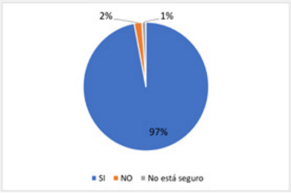
Figura 2. ¿Le gustaría que se siguieran realizando clases espejo?

En relación con la pregunta sobre lo que piensan las estudiantes sobre seguir realizando las clases espejos, en la figura 2, se puede apreciar de una manera casi contundente que se desea que se realicen. Indican que aprendieron debido a las metodologías de ambos docentes donde se logran complementar haciendo que los estudiantes puedan aclarar diferentes conceptos.