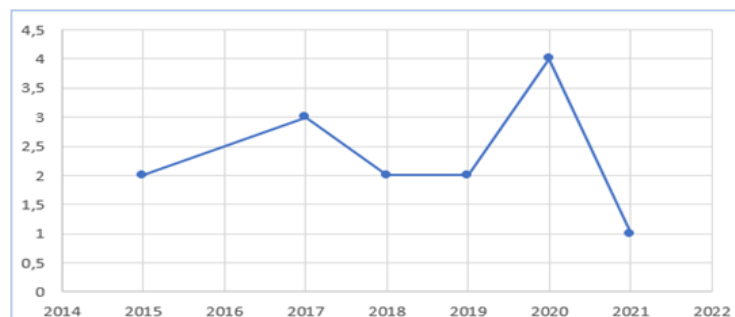
Figura 2. Línea cronológica

Por su parte, la figura 2 resume la línea cronológica de tiempo de los estudios resultantes. Empieza en el 2015 y el 2020 es el año con mayor número de publicaciones en este campo.